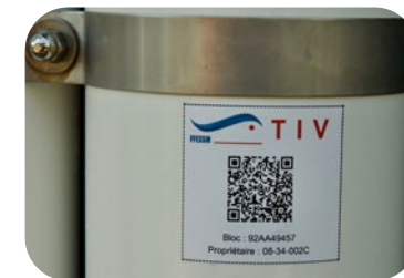
Exemple sur le fut

D'autres usages sont possibles (impression papier et film de protection autocollant, pochette autocollante type assurance moto ...).