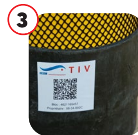
Exemple sur le culot

Il suffit ensuite d'imprimer le pdf généré sur un papier autocollant de type « waterproof » et de l'apposer sur la bouteille.